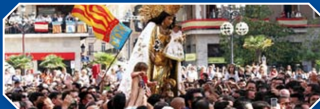
EL TRASLADO DE LA VIRGEN