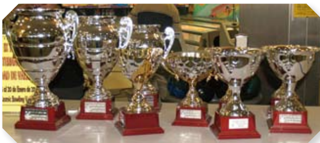
LOS TROFEOS DE LOS CAMPEONATOS