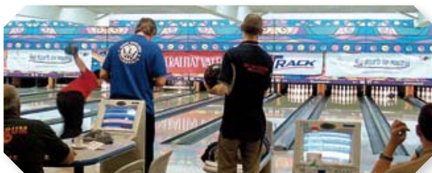
LA COMPETICIÓN EN MARCHA