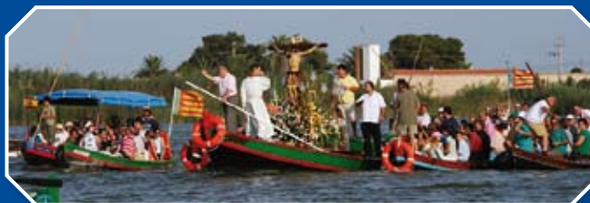
LAS BARCAS DEL PALMAR