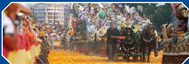
LA BATALLA DE FLORES