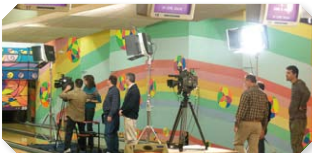
LOS COMPAÑEROS DE PUNT-2